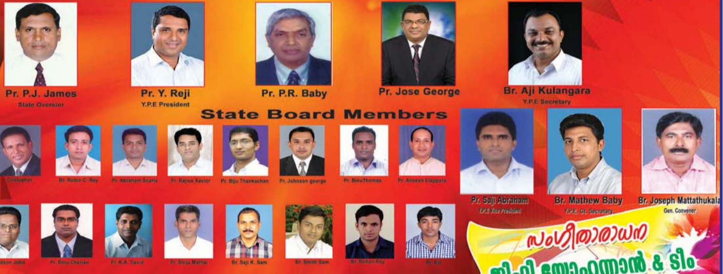
State Board Members