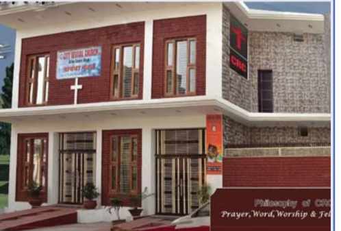
പാസ്റ്റർ എബി സാമുവേൽ ലുധിയായിലെ സിറ്റി റിവൈവൽ ചർച്ച്