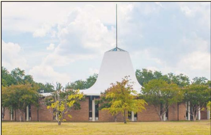
ഡാളസ് റ്റാബർനാക്കിൾ ഐ.പി.സി. ചർച്ച്

പ്രേഷിത ദൗത്യനിർവ്വഹണത്തിൽ ക്രൈസ്തവധർമ്മം കാത്തു സൂക്ഷിച്ചു മുന്നേറുകയാണ് ഐ.പി.സി. റ്റാബർനാക്കിൾ ഡാളസ്. സുവിശേഷീകരണത്തിനും ജീവകാരുണ്യത്തിനും മുൻതൂക്കം നൽകുന്ന സഭ ഇന്ന് വളർച്ചയുടെ പടവുകൾ പിന്നിടുകയാണ്. ദൈവവചനത്തിന്റെ വ്യവസ്ഥയിൽ നിന്നുകൊണ്ട് കുടുംബബന്ധങ്ങൾക്കും ക്രിസ്തീയ സ്നേഹത്തിനും വിശ്വാസികൾ തമ്മിലുള്ള ഊഷ്മളമായ കൂട്ടായ്മയും പ്രാധാന്യം നൽകുന്ന സഭ ഇന്ന് ഡാളസിലെ പ്രധാന സഭകളിലൊന്നായി വളർന്നുകഴിഞ്ഞു.