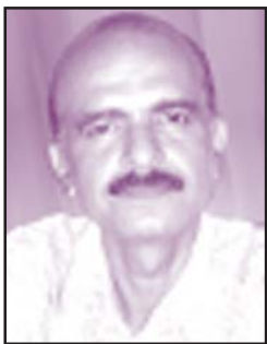
ജോർജ്ജ് പിരിയർ തെക്കേക്കര

ചോദ്യം: യൂക്രിയൻകളായ ചിലർ ഹിന്ദുമതഗ്രന്ഥമായ 'മഹാഭാരത'ത്തിലെ അവതാരപുരുഷനായ 'കൃഷ്ണനെ'യും വേദപുസ്തകത്തിലെ ക്രിസ്തുവിനെയും താരതമ്യപ്പെടുത്തി, സാമ്യമുണ്ടാക്കി പ്രസംഗിക്കാറുണ്ട്. മറ്റു മതഗ്രന്ഥങ്ങളും വേദപുസ്തകവും ഒരേ സത്യമാണോ പ്രഘോഷിക്കുന്നത്? മറ്റുള്ള മതഗ്രന്ഥങ്ങളും വേദപുസ്തകവും താരതമ്യം ചെയ്യാമോ?