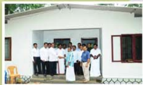
തീക്കോയിയിൽ വിദ്യാർത്ഥികൾ പണിതു കൊടുത്ത വീട്