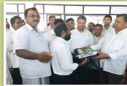
ഓരോ വർഷവും നടത്തി വരുന്ന വിദ്യാർത്ഥ സഹായങ്ങൾ

വടക്കൻ കേരളത്തിലും, തെക്കൻ കേരളത്തിലും നടത്തപ്പെട്ട മേഖലക്യാമ്പുകൾ