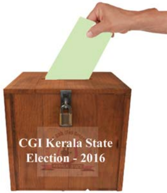
നൂ വിപരീതമായി 15 അംഗ കൗൺസിലിൽ പുതുമുഖങ്ങളുടെ എണ്ണം വർദ്ധിക്കുവാനുള്ള സാധ്യതയാണ് ഇക്കൂറിയുള്ളത്. ഓവർസിയർ ഇലക്ഷൻ (പ്രി

ഗതിക്കോ വേണ്ടി ഒന്നും പ്രവർത്തിക്കാത്തവരാണ് ബഹുഭൂരിപക്ഷം കൗൺസിൽ അംഗങ്ങളും എന്ന വിമർശനം പരക്കെ ഉണ്ട്. കൗൺസിൽ അംഗം എന്ന പദവി ഉപയോഗിച്ച് വലിയ സഭകളും ഡിസ്ട്രിക്ടുകളും മറ്റ് ചുമതലകളുമൊക്കെ അടിച്ചെടുക്കുക മാത്രമാണ് നടക്കുന്നതെന്ന് ശുശ്രൂഷകന്മാർ പരാതിപ്പെടുന്നു. സഭയുടെ പുരോഗതിക്കും ശുശ്രൂഷകന്മാരുടെ ക്ഷേമത്തിനുംവേണ്ടി കാഴ്ചപ്പാടുള്ളവരും ദുരുപദേശത്തിനും അഴിമതിക്കുമെതിരെ ശക്തമായ നിലപാടെടുക്കുന്നവരും കൗൺസിലിൽ എത്തണം എന്ന അഭിപ്രായമാണ് പൊതുവെ ഉള്ളത്. അതുകൊണ്ട് തന്നെ പതിവി