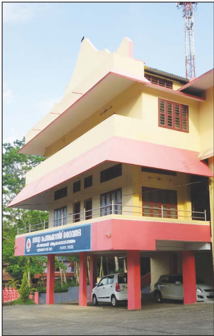
ഐ. പി. സി. റാന്നി-നെല്ലിക്കാമൺ താബോർ പ്രാദേശിക സഭ