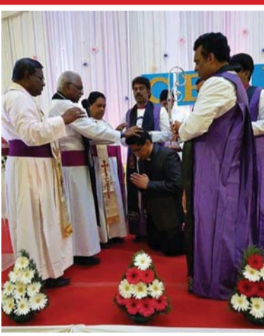
വ്യ എന്തൊക്കെ പ്രചരിപ്പിച്ചാണ് ഇക്കൂട്ടർ ബിഷപ്പ് കുപ്പായം ഇടുന്നത്. വേണ്ടത്ര ദൈവശാസ്ത്രപഠനമോ, സാമൂഹ്യ അംഗീകാരമോ, ദൈവനിയോഗമോ ഇല്ലാത്ത ഇവരുടെ ബിഷപ്പ് വേഷങ്ങളെ സമൂഹം തമാശയായി മാത്രമാണ് കാണുന്നത്.