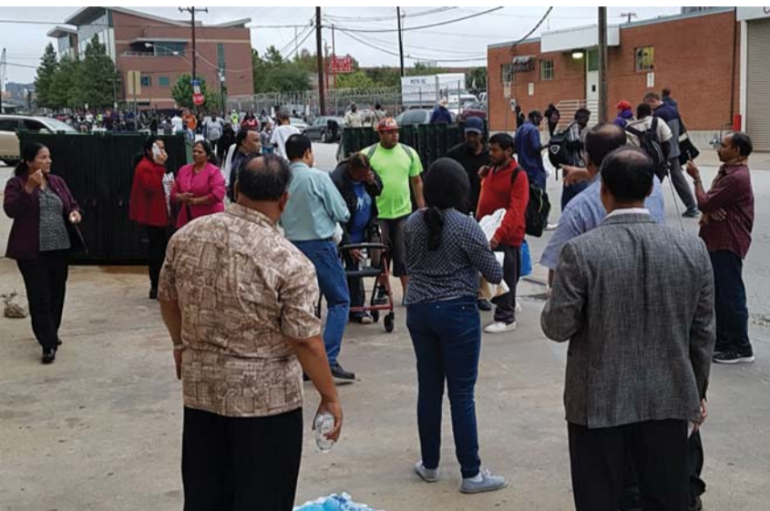
ബെഥൽ റിവൈവൽ ചർച്ച് ശുശ്രൂഷകരും അംഗങ്ങളും ഭക്ഷണപൊതി വിതരണം നടത്തുന്നു

സമ്പന്നതയുടെ മടിത്തട്ടിൽ വിരാജിക്കുന്നവരാണ് അമേരിക്കക്കാർ എന്ന പൊതുധാരണയാണ് എല്ലാവർക്കും ഉള്ളത്. എന്നാൽ ഒരു നേരത്തെ ആഹാരത്തിനായി കൊതി