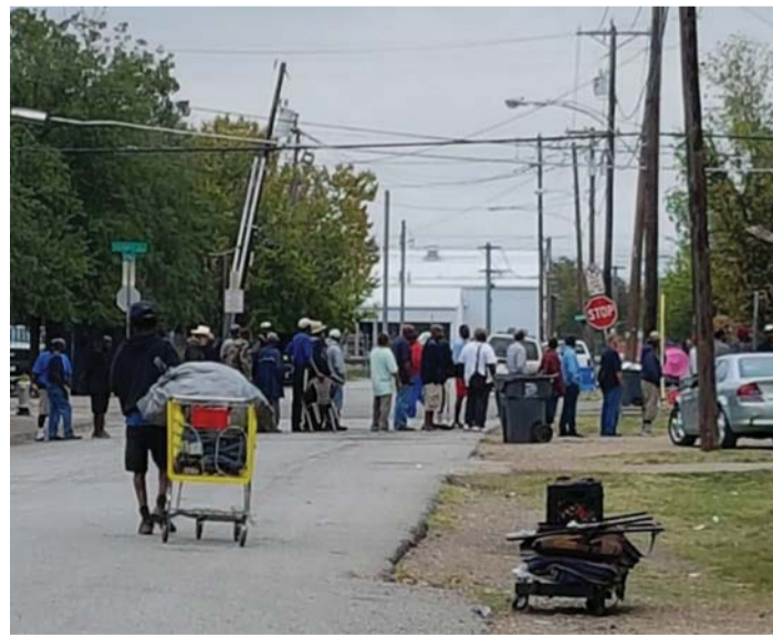
ഭക്ഷണ വിതരണത്തിനായി തെരുവിൽ കൂട്ടി നിൽക്കുന്നവർ

തെരുവിലേക്കും ഒരു കൈ സഹായം നൽകാൻ മലയാളി പെന്തക്കോസ്ത് സമൂഹം തയ്യാറായാൽ അത് വലിയൊരു മാറ്റമാകും തീർച്ച.