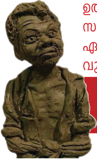
ഛർദ്ദിച്ചുവീണു, ബോധം മറഞ്ഞു

അഗളി പോലീസിന്റെ 87/18 ക്രൈം നമ്പർ എഫ്ഐ ആറിലെ പ്രസക്തഭാഗങ്ങൾ.